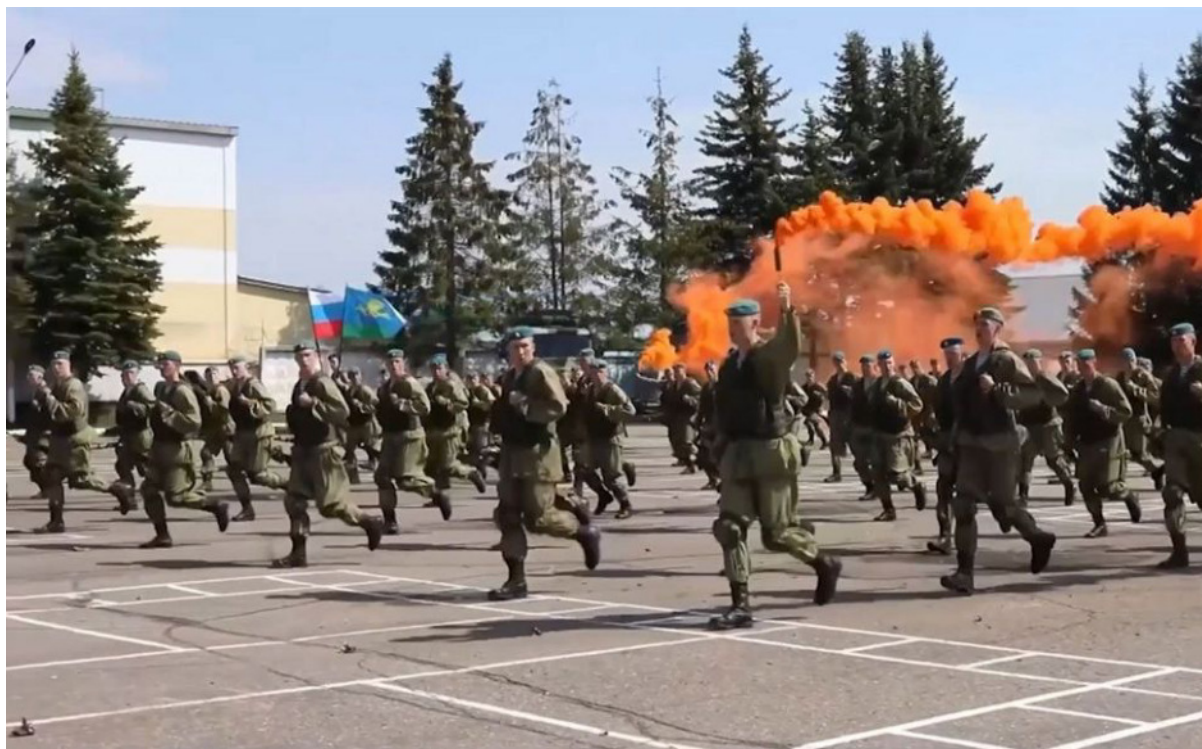
331 pułk na placu apelowym

Koszt wojny ukraińskiej dla jednego rosyjskiego pułku