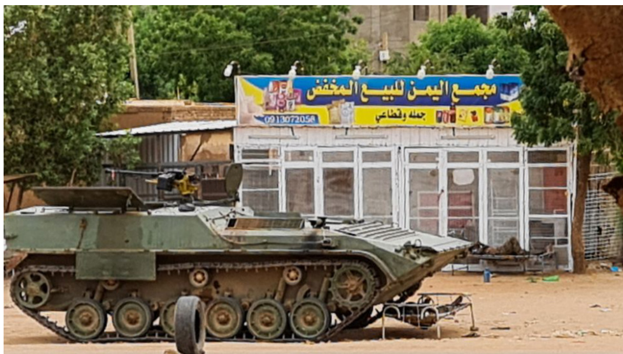
Punkt kontrolny Armii sudańskiej w Chartumie

Kryzys sudański: pomimo rozejmu zbombardowano Chartum