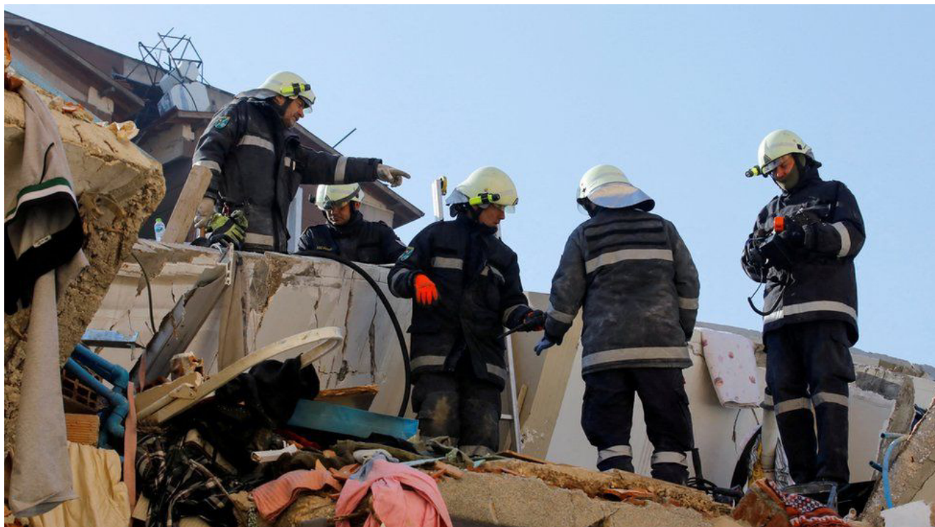
Członkowie Austrian Forces Disaster Relief Unit szukają ocalałych w tureckiej prowincji Hatay

Niepokoje w południowej Turcji zakłóciły działania ratunkowe po poniedziałkowym śmiertelnym trzęsieniu ziemi.