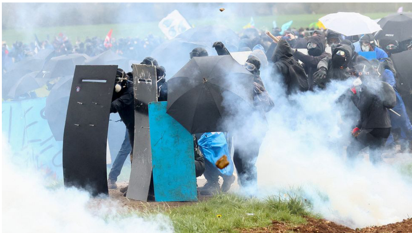
Protestujący w Sainte-Soline starli się z policją

Francuska policja wystrzeliła gaz łzawiący do protestujących podczas dużej demonstracji na zachodzie kraju.